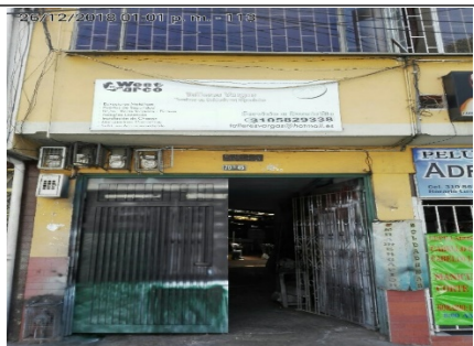
FOTOGRAFÍA No 1. FACHADA DEL PREDIO