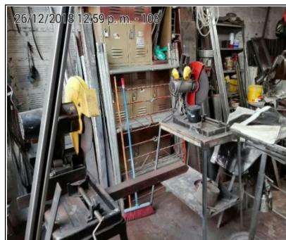
FOTOGRAFÍA No 4. AREA DE CORTE