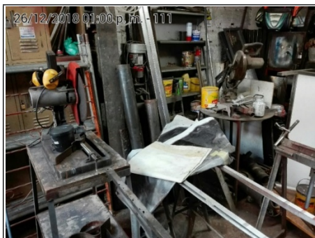
FOTOGRAFÍA No 5. AREA DE PULIDO