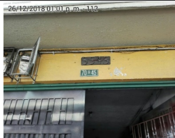
FOTOGRAFÍA No 2. PLACA DEL PREDIO